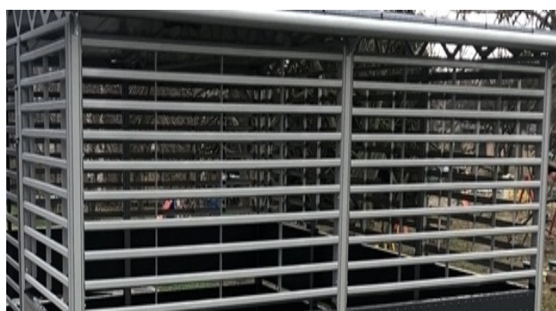
Kolorystyka elementów ażurowych