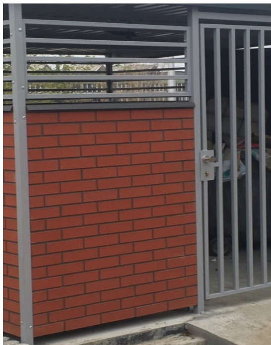
Kolorystyka ścianki frontowej